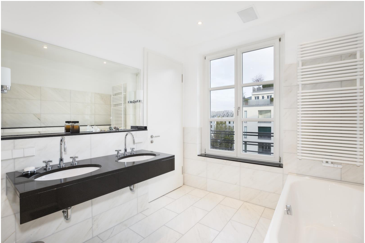
Masterbad mit Wanne und Dusche