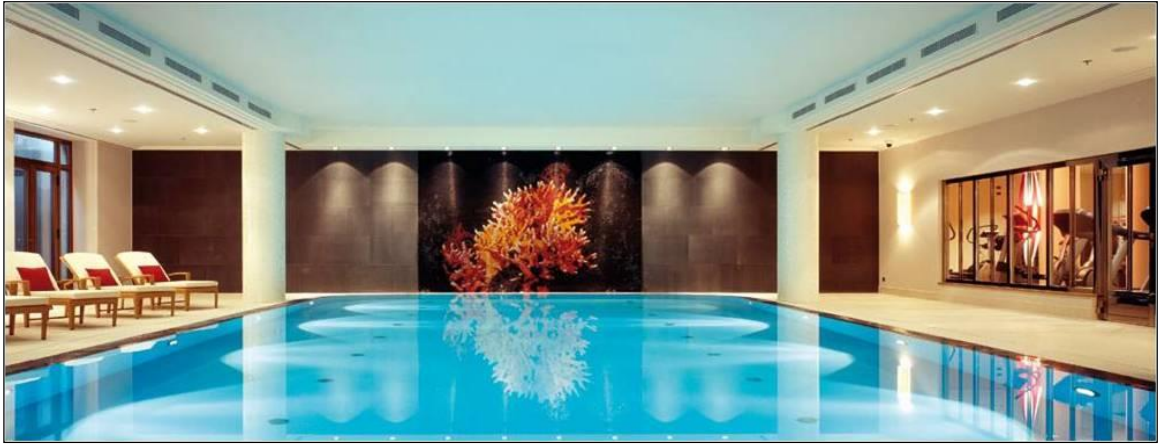
Wellness Bereich im Charles Hotel