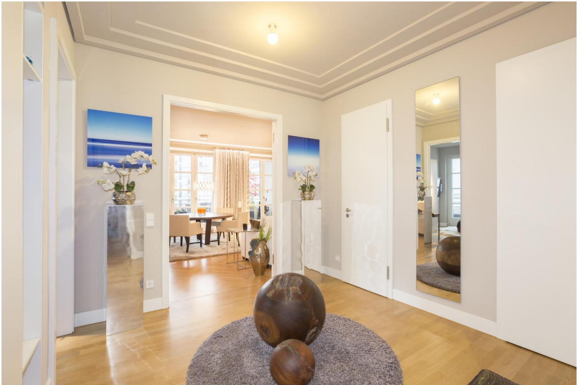
Wohnbereich mit Flair