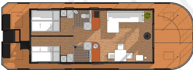
Grundriss Variante I (mit Sonderausstattung 2. Schlafzimmer)