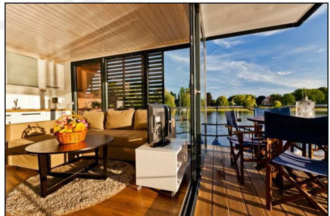
Wohnraum mit Vordeckterrasse