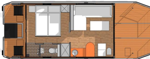
Grundriss Variante II