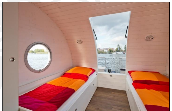
Schlafraum mit Einzel- und ausziehbarem Doppelbett