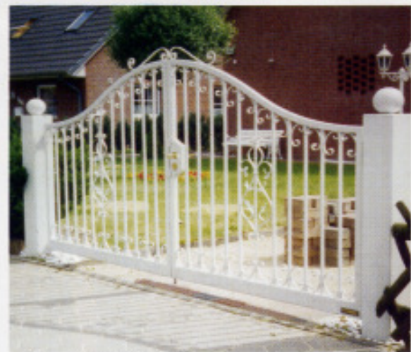
Tor „Heidehof“, Pfosten oben stumpf mit Kugel