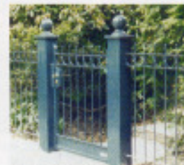
„H1“ leichte Ausführung