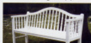
Syltbänke in Stahl (P)