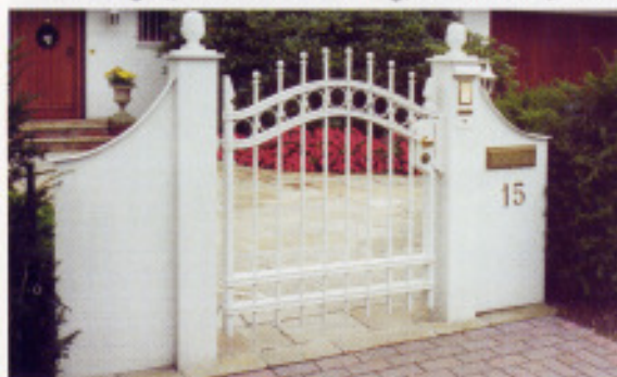
„H1“-Pforte mit Seitenteilen aus 5mm Stahlblech