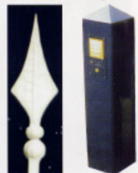
„1914“Spitze Pfosten oben spitz