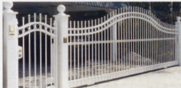
„Hamburger Kaufmanns“Pforte u. Schiebetor mit Automatik