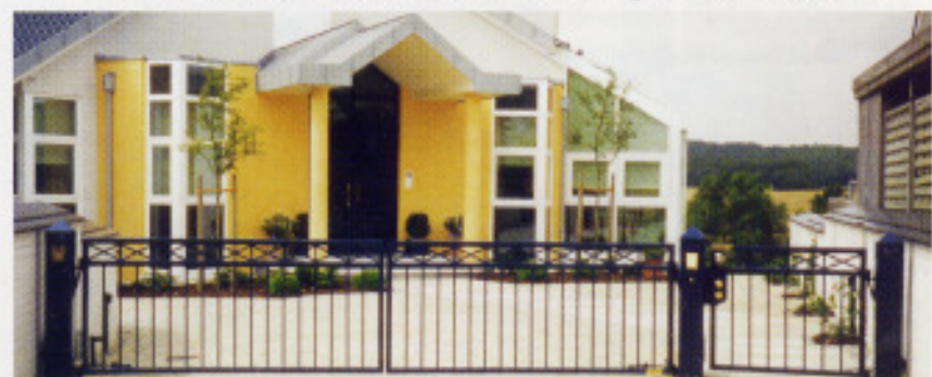
Toranlage mit Andreaskreuz oben, Automatik „SG135“, Sprechanlage