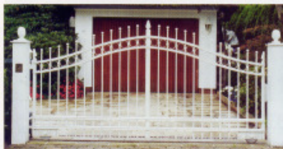
„H1“ als Schiebetor, optisch 2-flügelig

Alle Tore nach Maß und Wunschdesign. Feuerverzinkt, speziallackiert und montiert. Sprechanlage mit Verbindung zur bauseitigen Telefonanlage. Torautomatik mit allen Sicherheitseinrichtungen. Funk mit im Auto eingebauten Spiegelsendem kompatibel. Flacher und allseitig überfahrbarer Mittelanschlag.