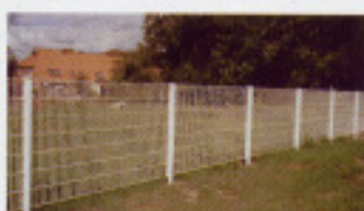
„Stabo“-Gitter und Tore (P)