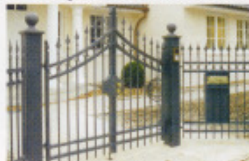
„H1“ mit Spitzen von „1914“