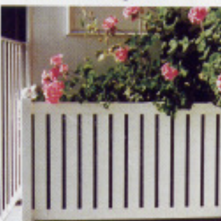
Blumenkübel nach Maß (P)