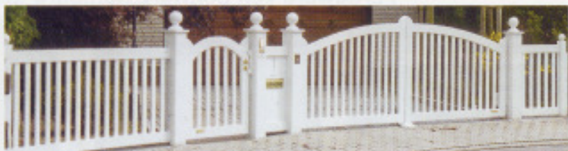
Friesentoranlage „F32“ mit Automatik „SG135“ (P)

(P) = soweit nicht schon beigefügt, bitte Extra-Prospekt anfordern