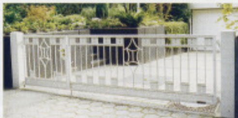
Tor nach alten Fotos