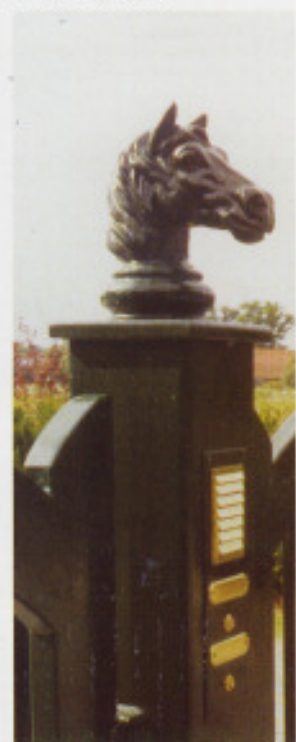
Pfosten mit Pferdekopf