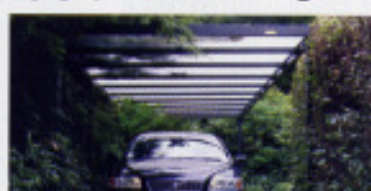
Carport in Stahl mit Glas, auch als 2 Stützen-Konstruktion (P)