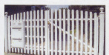
Aluminiumgitter und Tore (P)

(P) = soweit nicht schon beigelegt, bitte Extra-Prospekt anfordern!