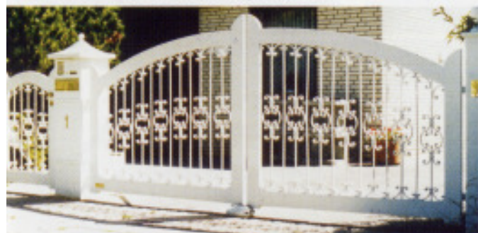
Friesentor „F32“ mit geschmiedeter Füllung (P)