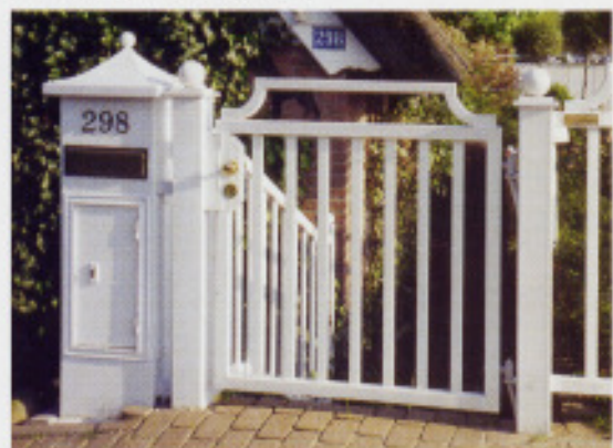
Pforte, schlicht und schön