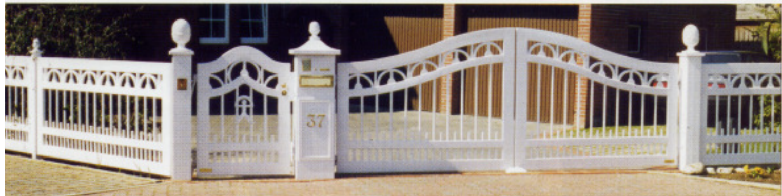
„F15“ Friesentor und Gitter, Großraumbriefkasten, Torautomatik „SG135“, Sprechanlage, Torpfosten mit Ananas