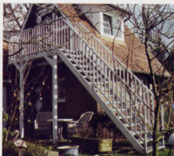
Treppen und Podeste (P)