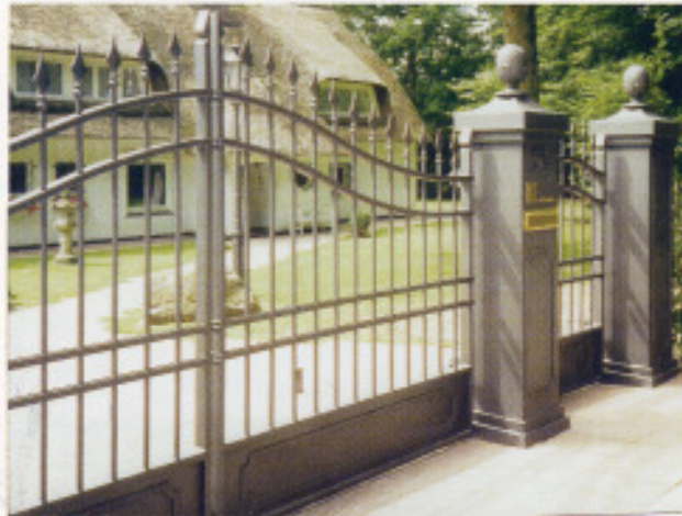
Toranlage „1914“ ohne Füllung, Automatik „SG135“