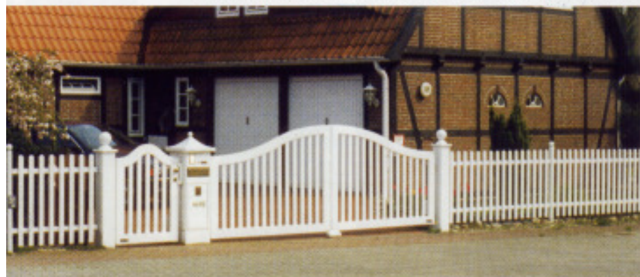
Friesentoranlage „F17“, Lattenzaun auch aus Stahl, Automatik „SG135“

Feuerverzinkt bei 450 Grad Celsius in flüssigem Zink. Hohlprofile auch von innen. Danach mit spezial Kunststofflack lackiert. Dies hält sogar auf Sylt, für Generationen. Flügeltore und Schiebetore mit Schiene oder freitragend, mit und ohne Bogen. Torautomatik, auch für alle vorhandenen Tore. Einschließlich kompletter Montage.