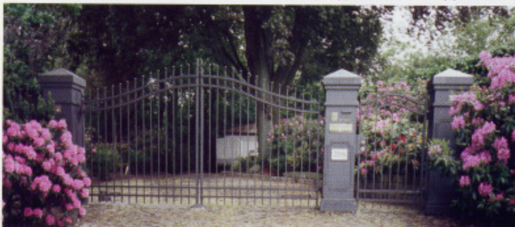
„H1“ Toranlage mit Automatik „SG 135“, Portalstoppfosten ohne Kugel