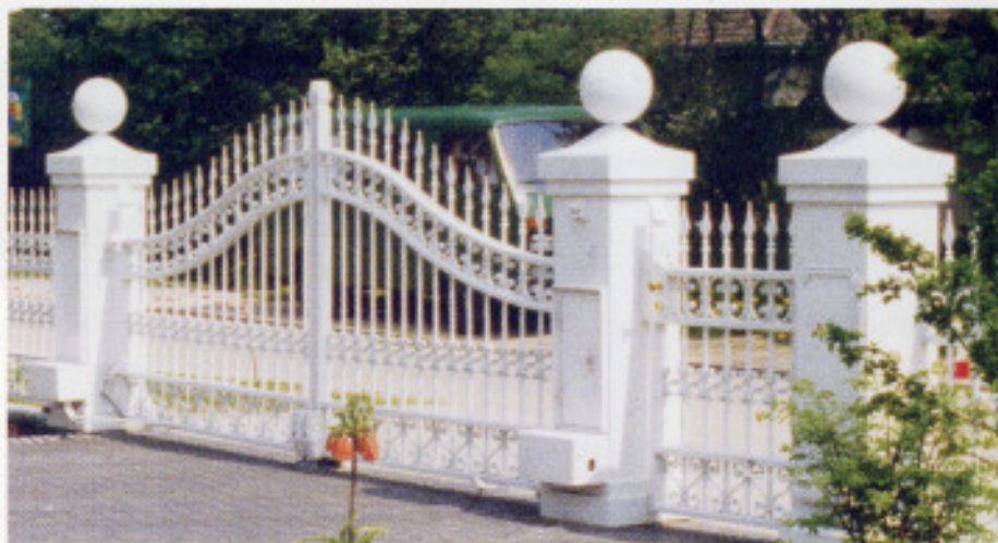
Klassik Gitter und Tor „1914“, Automatik „SG135“ Portaltorpfosten mit Briefkasten