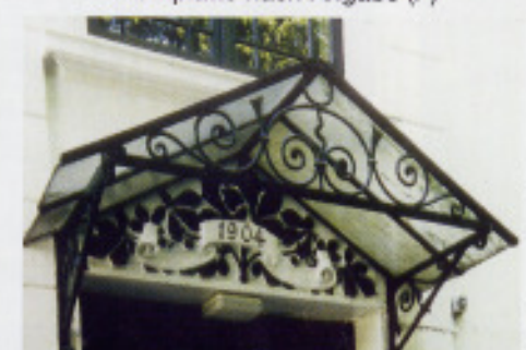
Vordächer nach historischen Vorbildern (P)

Fertigware von Schwarz Hamburg geprüft und für gut befunden: