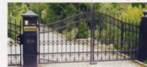
„1914“ mit Kugeln vom „H1“ Gitter