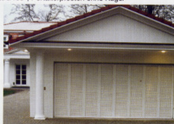
Garagenkipptore bis 9,0m Breite (P)