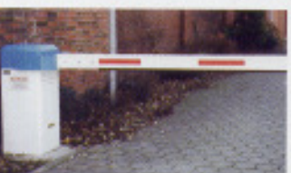
Schranken und Pkw-Sperren (P)

Fertigware von Schwarz Hamburg geprüft und für gut befunden: