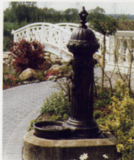
Brunnen und Brücken (P)