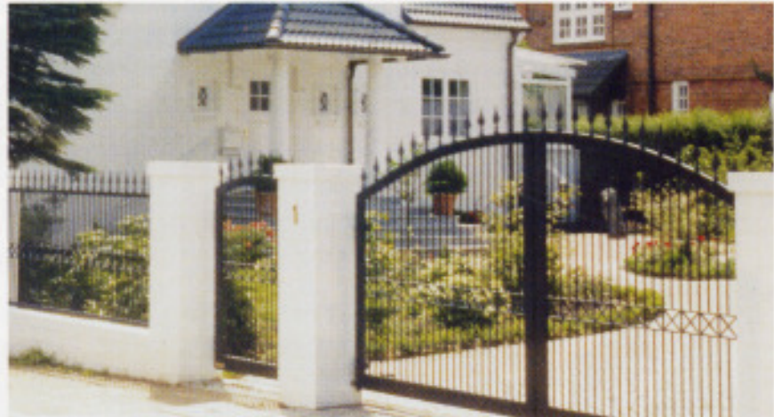
Gitter und Tor mit Spitzen und Andreaskreuz mittig, Automatik „SG100“