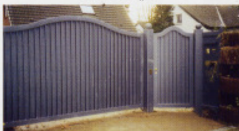
Friesenportal „F17“, geschlossen