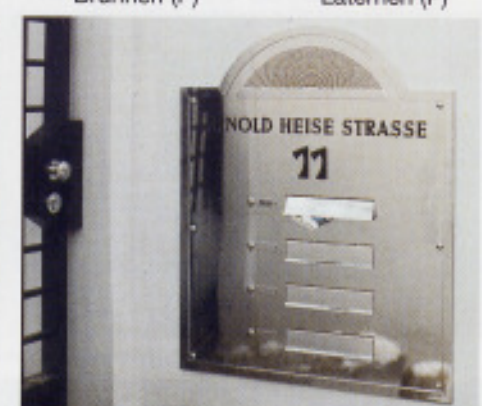
Frontplatte nach Angabe (P)