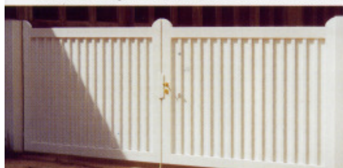
Friesentor „F30“, geschlossen