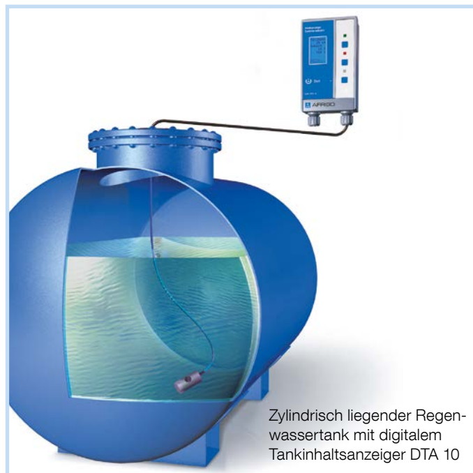
Zylindrisch liegender Regenwassertank mit digitalem Tankinhaltsanzeiger DTA 10

Der elektro-pneumatische Tankinhaltsanzeiger DTA 10 besteht aus einem batteriebetriebenen Auswertegerät mit digitaler Anzeige und einer Messleitung. Die Messwertanzeige erfolgt in Liter, % und Füllhöhe (cm). Einfache Bedienung und Geräteeinstellung über drei Funktionstasten. Messungen werden auf Anforderung durch Betätigung der Steuertaste (Push-To-Read-Funktion) durchgeführt. Bei Unterschreitung eines frei einstellbaren prozentualen Minimalfüllstandes erfolgt optische Alarmgabe im Rahmen eines Messvorganges, die Hintergrundbeleuchtung des Displays blinkt rot. Handelsübliche Tankformen (linear, kugelform und zylindrisch liegend) sind hinterlegt. Messleitungsanschluss für Schlauch mit 4 mm Innendurchmesser.